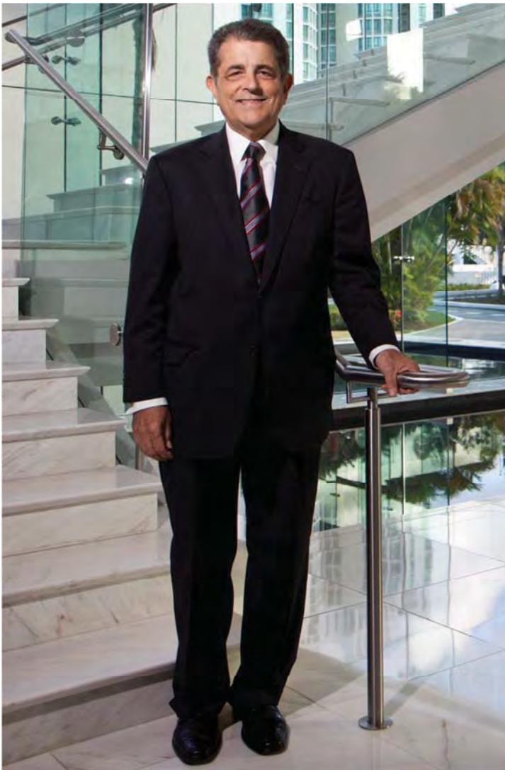
Federico Hernández Denton Juez Presidente del Tribunal Supremo

Toda institución que aspire a funcionar de manera ordenada y responsable debe tener claros sus objetivos y la manera más adecuada de alcanzarlos conforme a sus recursos y prioridades. Sin embargo, cuando se trata de una institución pública, como la Rama Judicial, es necesario reconocer que hay exigencias muy especiales. Por más importantes que puedan ser los procesos y aspectos internos, es primordial mantener el foco en lo esencial de administrar un sistema judicial: se está dando un servicio al pueblo. El Plan Estratégico 2012-2015 que presentamos se enmarca en el reconocimiento de esa responsabilidad.