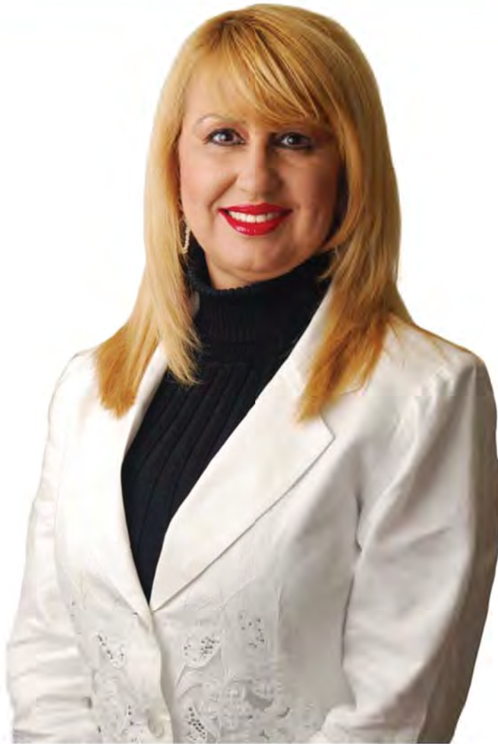
Sonia Ivette Vélez Colón Directora Administrativa de los Tribunales

Uno de los mayores retos y satisfacciones para una administradora o administrador en el servicio público es emprender la tarea de planificar cuidadosamente la estrategia a seguir para lograr la mayor efectividad en los planes de trabajo en nuestra agenda de servicio al país. Esa experiencia la vivimos con nuestro Plan Estratégico 2007-2011: Obra de Justicia , donde igualmente fue satisfactoria su divulgación, el ver como los componentes organizacionales se insertaban en el Plan y finalmente como la gran mayoría de las metas propuestas se hacían realidad.