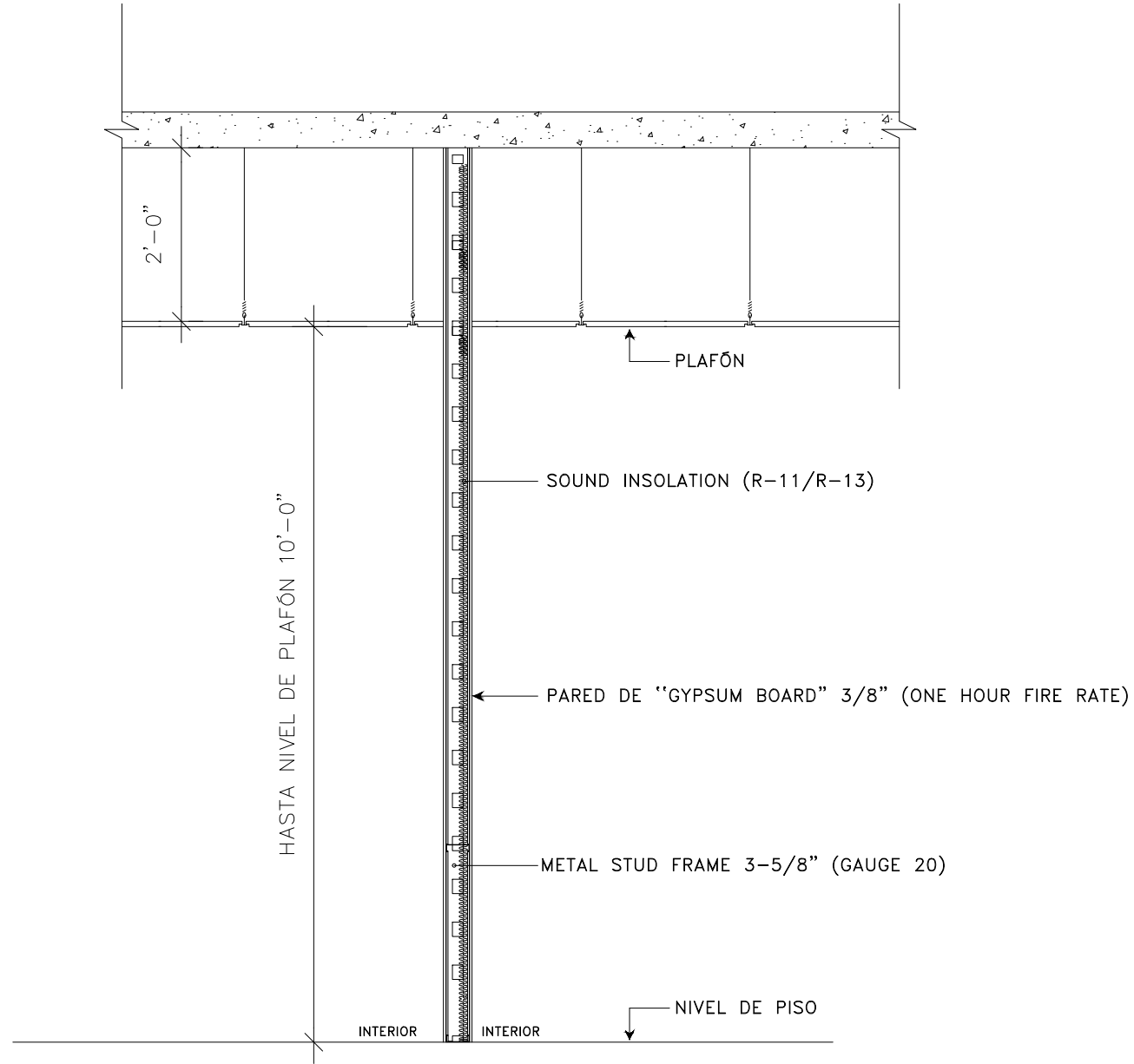
DETALLE DE PARED DE GYPSUM BOARD NO A ESCALA